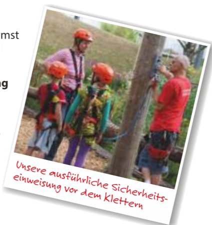
Unsere ausführliche Sicherheitseinweisung vor dem Klettern

Vor dem Klettern bekommst Du eine professionelle Ausrüstung und eine ausführliche Einweisung durch unsere Guides. Während des Kletterns bist Du immer gesichert. Die Guides haben Dich ständig im Auge, sind jederzeit für Dich ansprechbar und seilen Dich ab, wenn Du nicht mehr kannst.