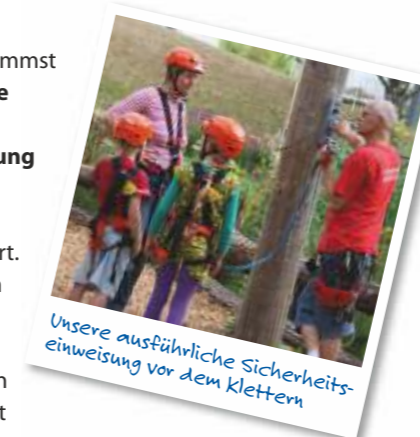
Unsere ausführliche Sicherheitseinweisung vor dem Klettern

Vor dem Klettern bekommst Du eine professionelle Ausrüstung und eine ausführliche Einweisung durch unsere Guides. Während des Kletterns bist Du immer gesichert. Die Guides haben Dich ständig im Auge, sind jederzeit für Dich ansprechbar und seilen Dich ab, wenn Du nicht mehr kannst.